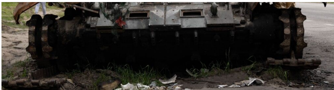
Tanc rusesc, distrus de forțele ucrainene

După cinci săptămâni de lovituri țintite ale artileriei ucrainene cu sistemele mobile HIMARS, avioane, depozite și centre de comandă rusești au fost distruse.