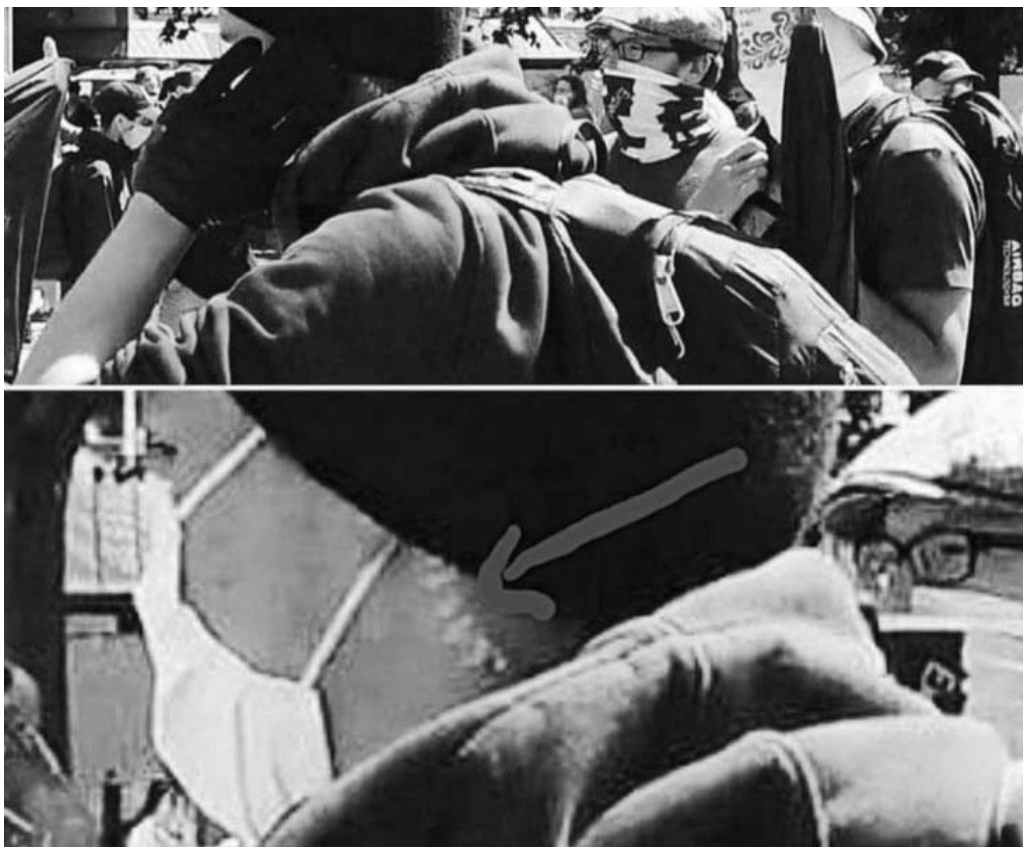
Coordonator al protestelor, posibil membru ANTIFA

Răzmerița s-a extins în zeci de orașe din Statele Unite, dar în mod inexplicabil a atins orașe precum Berlin, Londra, Paris, Bruxelles etc. care nu au nici în clin și nici în mîneacă cu poliția „rasistă” din Statele Unite sau cu uciderea unui personaj „de culoare”, anume George Floyd.