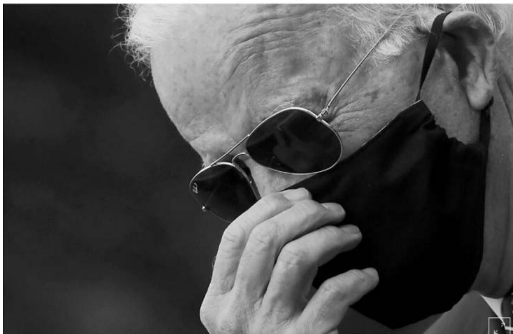
Joe Biden

WASHINGTON (Reuters) - Campaign staff for Democratic presidential candidate Joe Biden are advertising their donations to a group that pays bail fees in Minneapolis after the city's police jailed people protesting the killing of a black man by a white police officer.