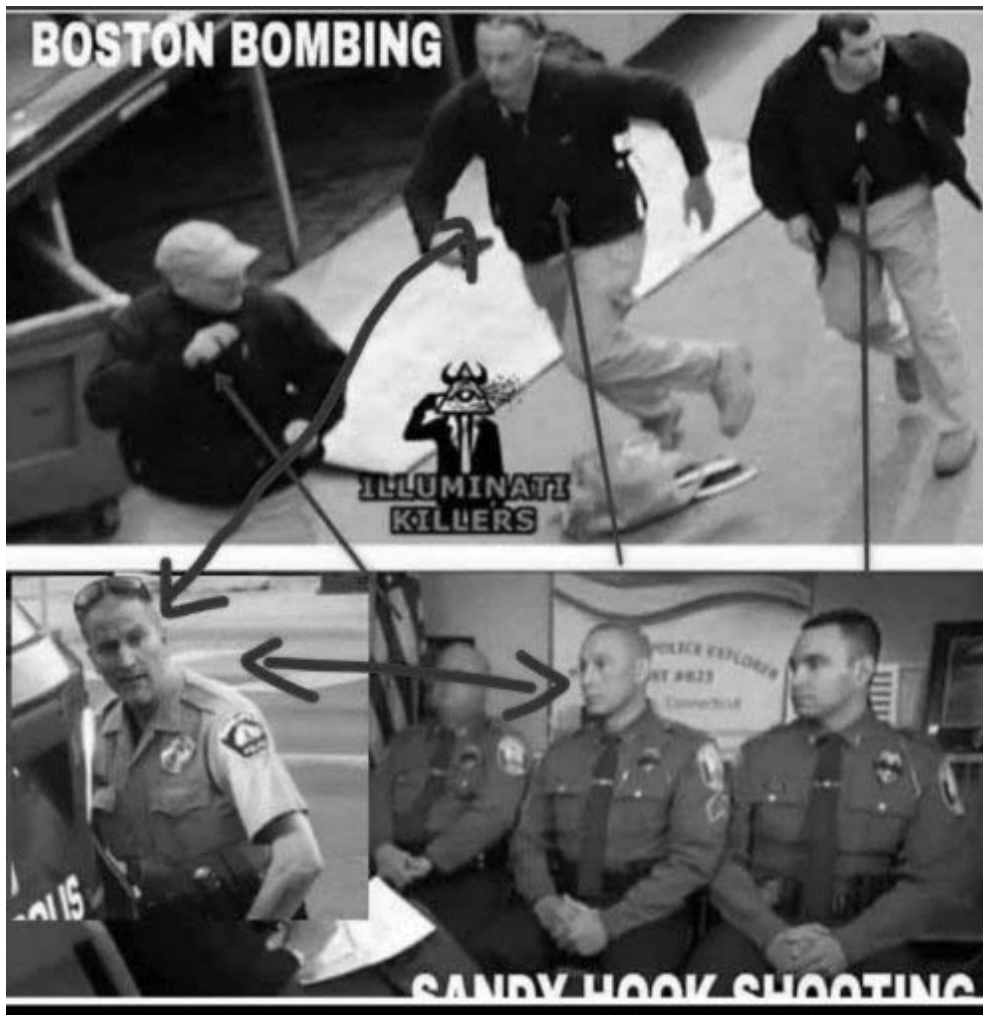
Derek Chauvin & co

Iar lucrurile par să se complice și mai mult pe siteurile așa-zis conspiraționiste, unde Chauvin și echipa lui par să fi participat la diverse evenimente ciudate precum atentatul cu bombă de la maratonul din Boston (Massachusetts, 2013) sau masacrul de la școala elementară Sandy Hook (Newtown, Connecticut, 2012).