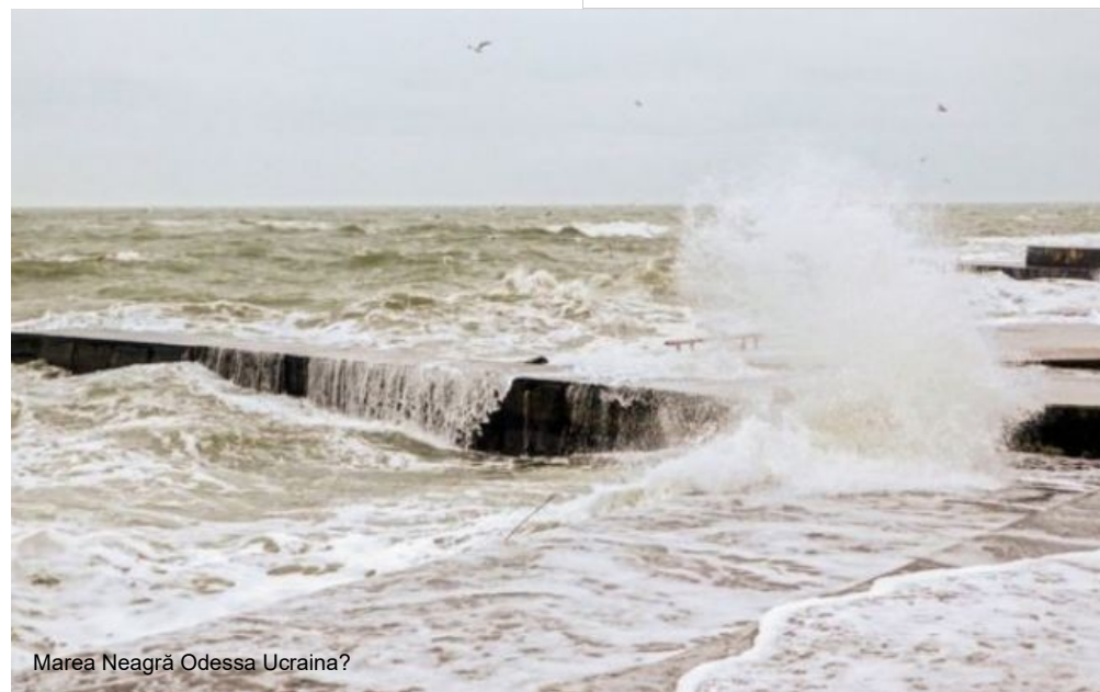
Marea Neagră Odessa Ucraina?